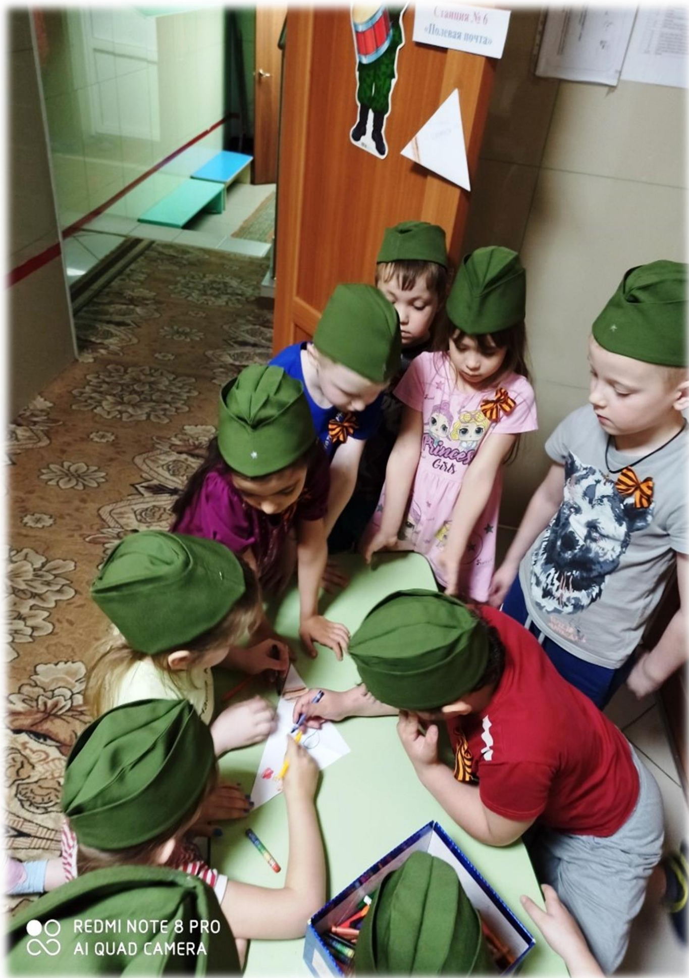
Станция «Полевая почта»